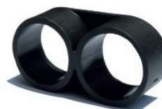
FINAL DE LÍNEA