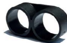
FINAL DE LÍNEA